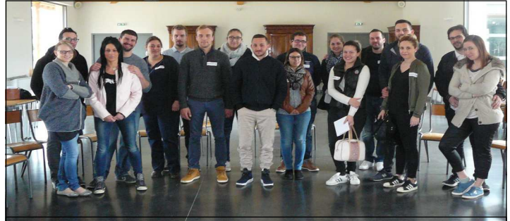
Journée du CPM, le 12 mars, à la maison Ste Anne

Ces différentes rencontres créent des liens et des amitiés.