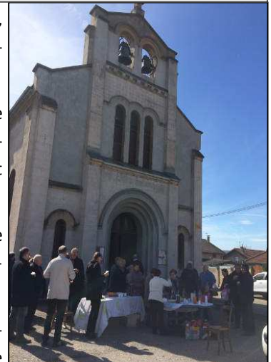
L'équipe relais de Beaulieu :

Nous remercions les deux prêtres, la chorale polonaise, les bénévoles qui nous ont aidés, l'école qui nous prêtait un toit en cas de mauvais temps ... et bien sûr tous les paroissiens présents.