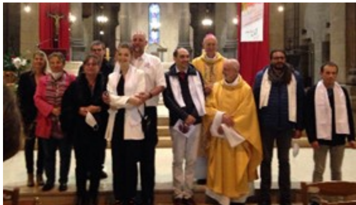
Les confirmands du 13 juin 2020

Il y a une dizaine d'années, je me suis trouvé face à un mur, c'est là où je me suis rendu compte que tout seul, je n'arriverai pas à m'en sortir. J'ai cherché autour de moi, et là, il y avait une personne qui m'a mené sur le chemin de la foi, depuis j'ai progressivement remonté la pente. La confirmation était ainsi pour moi une étape incontournable sur ce chemin de foi.