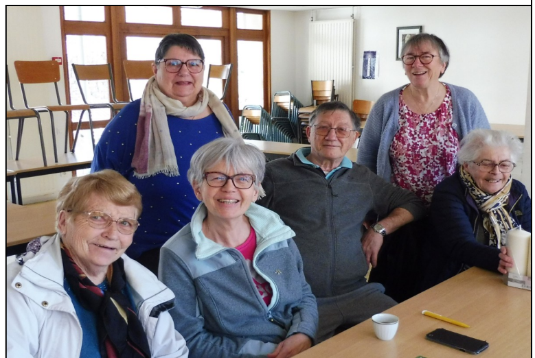
L'équipe Accueil lors des permanences d'accueil à Saint-Genest

A la maison paroissiale Ste-Anne à Roche-La-Molière, qui est le centre paroissial, des personnes se répartissent des permanences d'accueil tout au long de la semaine. Malheureusement, elles ne sont pas assez nombreuses pour assurer une régularité et il n'est pas rare que les personnes se rendant à la paroisse trouvent porte close. Si vous souhaitez donner un peu de votre temps pour assurer une permanence, n'hésitez pas à contacter la paroisse, nous prendrons le temps de vous former pour ce beau service !